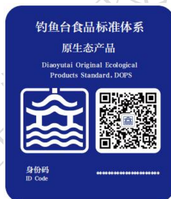
图 3 钓鱼台原生态产品标准认证标志